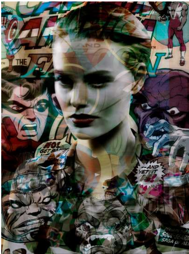
Black Canary (série All Star) 2016, tirage pigmentaire, contrecollé sur Dibond, verre anti-reflets, 177 × 134 × 4,8 cm, édition de 6 + 2 EA

Ces photographies très récentes s'inscrivent dans une thématique récurrente chez l'artiste. Elle est l'expression d'un chaos déjà exploré dans la série Still Life (2014) qui exposait le désordre de notre société de consommation. Avec les All Star 1 , Valérie Belin semble donner à voir la toxicité d'un monde mental chaotique, agité, saturé et obsessionnel. La présence de texte dans ces images a tendance à en renforcer une interprétation quelque peu inquiétante, avec des mots comme haunted (« hanté », The Stranger ), What would you do if you were the last man on earth? (« Que ferais-tu si tu étais le dernier homme sur terre ? », Miss Marvel ). Dans une image comme Black Canary , les personnages de comics qui jouxtent la jeune femme affichent des expressions d'une grande