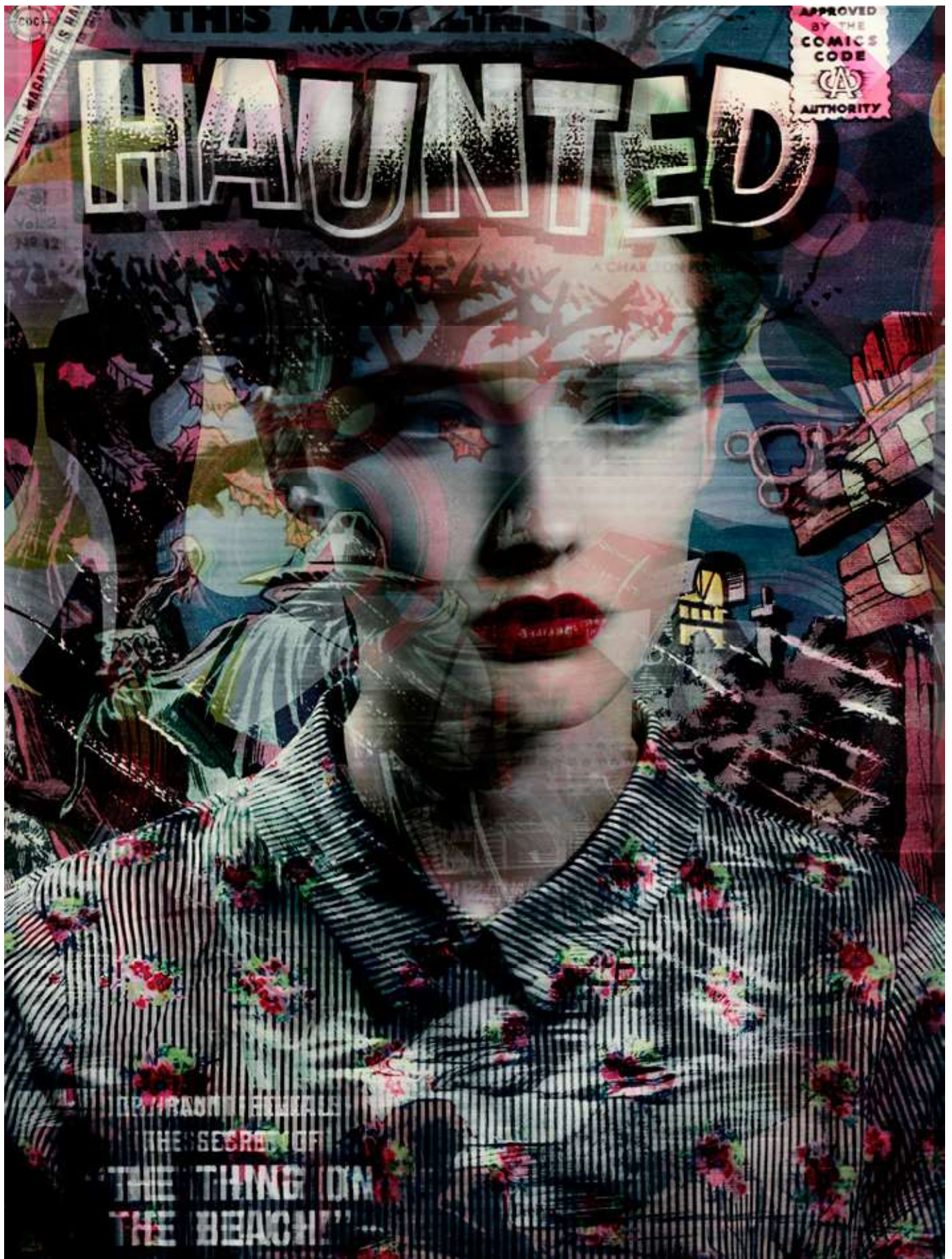
The Stranger (série All Star)

2016, tirage pigmentaire, contrecollé sur Dibond, verre anti-reflets, 177 x 134 x 4,8 cm, édition de 6 + 2 EA