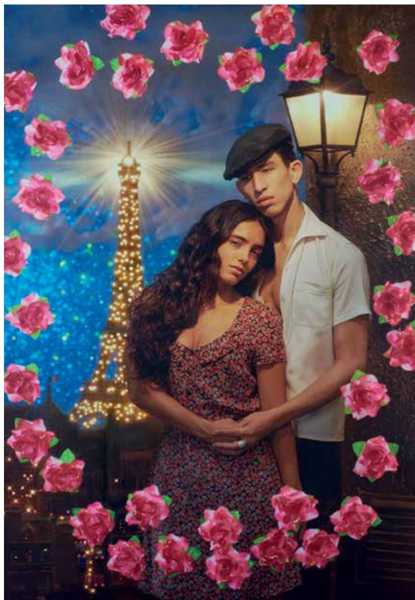
Pierre et Gilles, Les amants de Paris , 2018 © Pierre et Gilles