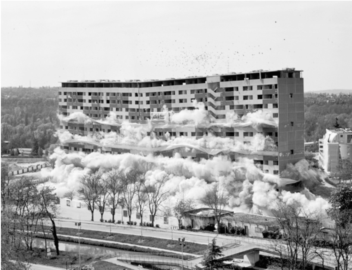
Mathieu Pernot, Implosion, Meaux, 24 avril 2004